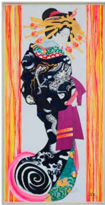
亜真里男「Gogh, Kiyoshiro & Me (Summertime Blues - Tokyo 2020)」 2016年作

本体2,700円+税、96ページ、B5変(185×246mm)、ハードカバー、カラー、 ISBN:978-4-908122-04-0 C0070