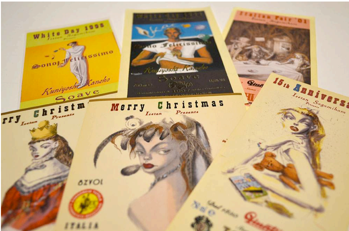
予約特典のワインステッカー